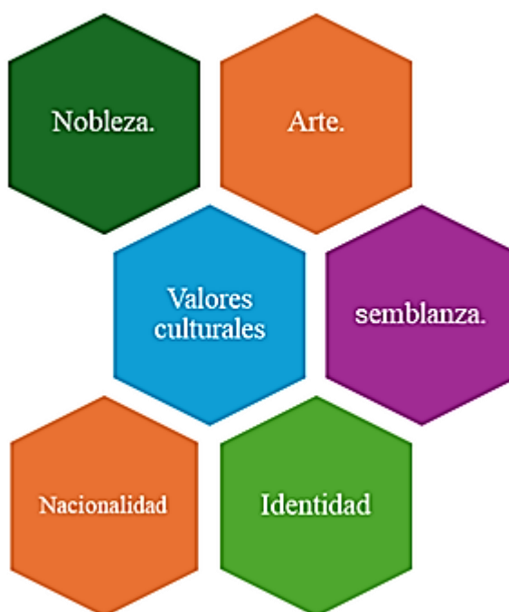
Figura 3. Valores culturales.

La interrelación entre los valores culturales, la nacionalidad, la identidad, el arte, la nobleza y la semblanza destaca la riqueza de la diversidad humana. Cada uno de estos elementos contribuye a formar un tejido complejo que define quiénes somos como individuos y como sociedad. Los valores culturales son el núcleo de nuestra identidad, influyendo en nuestras creencias y comportamientos, y se expresan a través del arte, que a su vez refleja las experiencias y emociones de un