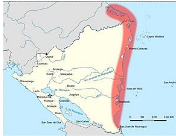
Figura 1. Ubicación geográfica