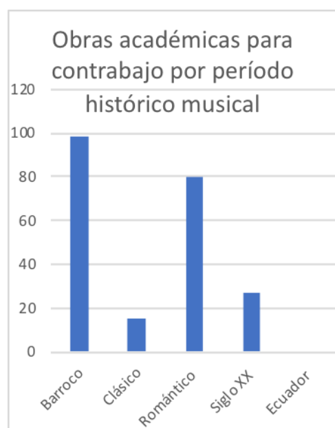
Tabla de obras por periodo y en el país

Esta tabla está realizada con la información del catalogo de “ International Music Company ”. Considerando las obras creadas en la Europa occidental que plantea de manera sólida los estándares del contrabajo.