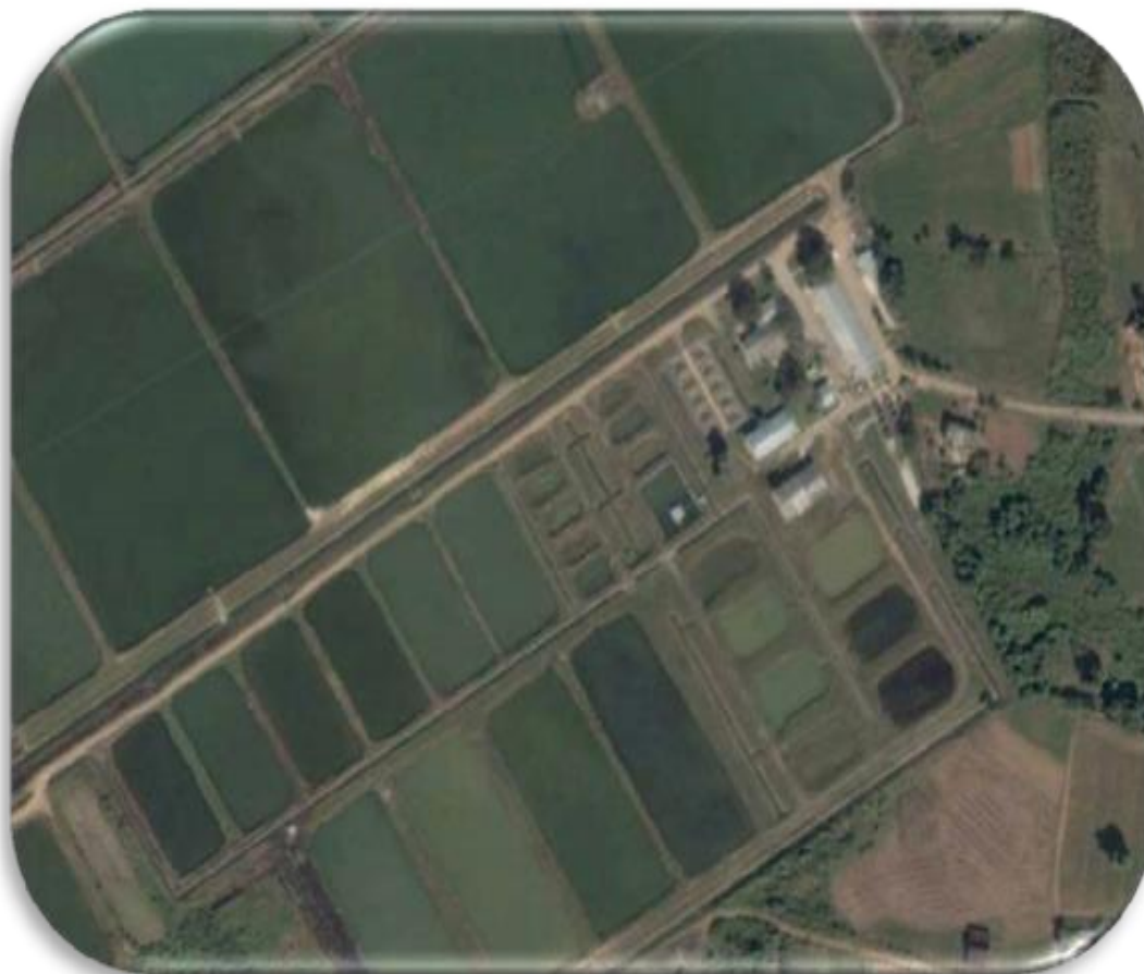
Figura 1. Imagen satelital del área de estudio. Pinar del Río, Cuba ( 22^{\circ} 33' 27.98''\text{N} , 83^{\circ} 18' 42.74''\text{W} ).

El estudio se realizó en el Centro de alevinaje La Juventud, Pinar del Río, Cuba, localizada en Paso Real de San Diego, municipio Los Palacios, provincia de Pinar del Río, Cuba (Fig. 1). Se realizaron dos muestreos por año, uno por semestre, durante el período comprendido del 2017–2019. Los tricodínidos fueron recolectados de alevines vivos ( n=30/\text{muestreo} ) de C. gariepinus cultivados en estanques de cemento de 3,5 \text{ m}^2 a razón de 10 000 alevines/estanque. El tamaño de muestra estuvo establecido según el Manual de pruebas de diagnóstico para los animales acuáticos de la OIE (2009).