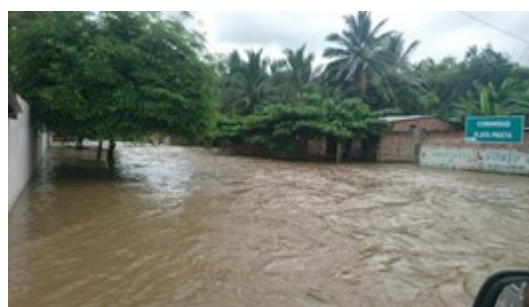
Figura 4. Inundación en la parroquia Abdón Calderón en 2023.

y viven en armonía. En cuanto a los servicios, no cuentan con distribución de agua potable y el abastecimiento de líquido vital se da por extracción directa de pozos o por distribución mediante tanqueros; existe una red de alcantarillado que solamente cubre el centro de la zona más poblada de la parroquia, donde existe un mercado y centro de faenamiento con escaso control de inocuidad. En las fotografías mostradas en la figura 4, se presenta la última inundación que afectó a esta parroquia durante marzo de 2023.