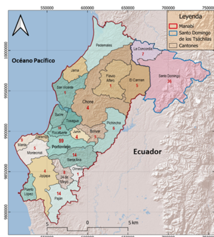
Figura 2. Casos de leptospiriosis por cantón en la Zona 4 durante el período 2019-2023.