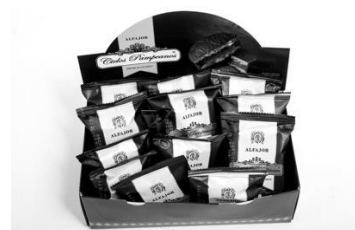
Figura 4. Alfajor Pampeano

Dentro de esta misma marca se introdujo una innovación en la receta: se incorporó chocolate semiamargo en la masa de la galleta, modificando así el sabor tradicional. Además, se utilizó un dulce de leche artesanal elaborado por campesinos de la zona de San Miguel de Tucumán, caracterizado por un sabor único con sutiles toques achocolatados y en lugar de mantener la cobertura clásica de coco, se optó por cubrir el producto en su totalidad con un baño de chocolate, lo que dio como resultado un alfajor diferente y distintivo frente a los que comúnmente se encuentran en el mercado.