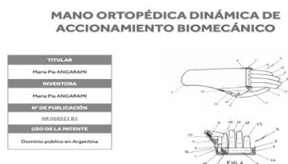
Figura 3. Mano Ortopédica Dinámica

Nota. Prosur- 2019 (Inventos creados y patentados por Mujeres)