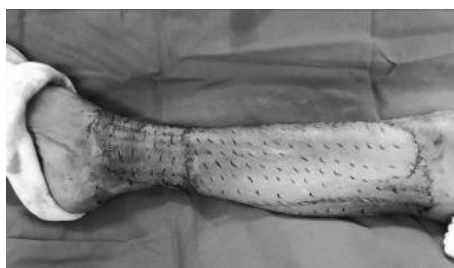
Figura 2. Innovación injerto de piel ( cultivo celular)Colombia-España

Nota. Castilla Martínez - 2021 (Cuantificación digital de integración de injertos de piel de espesor parcial ocluidos con sistema de presión negativa)